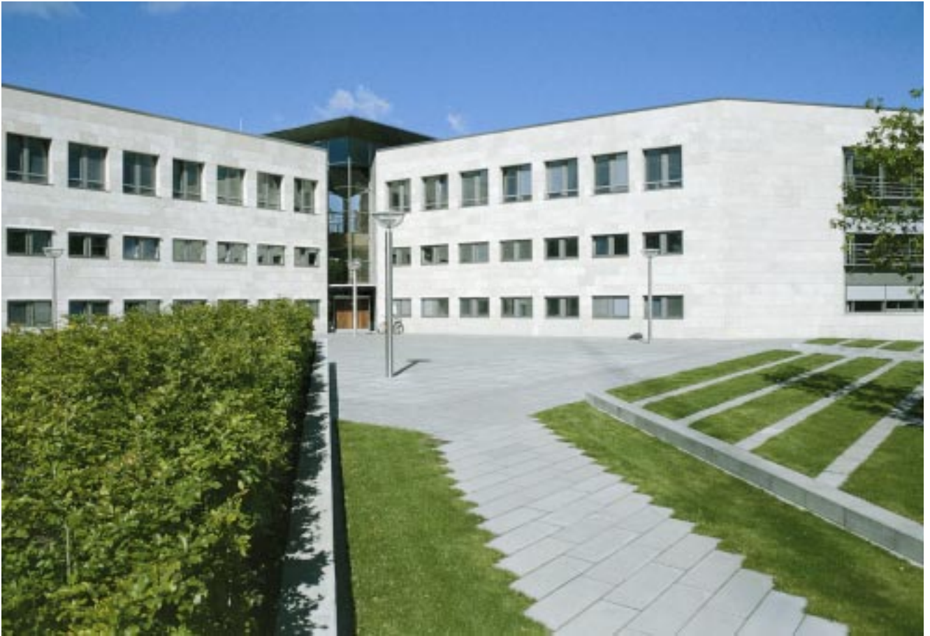
3. Forplads og bygning