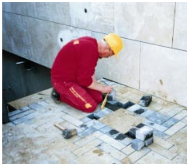
11. Tilpasning af sten