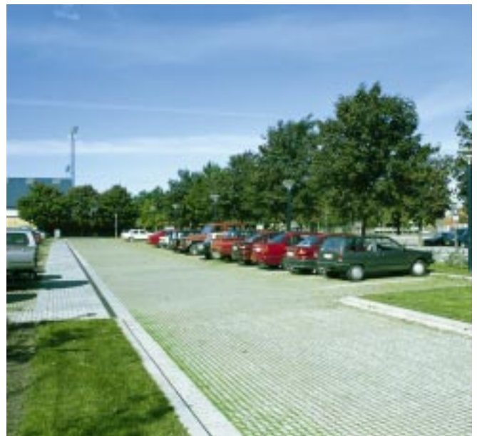
5. Parkeringsplads med græsarmeringssten