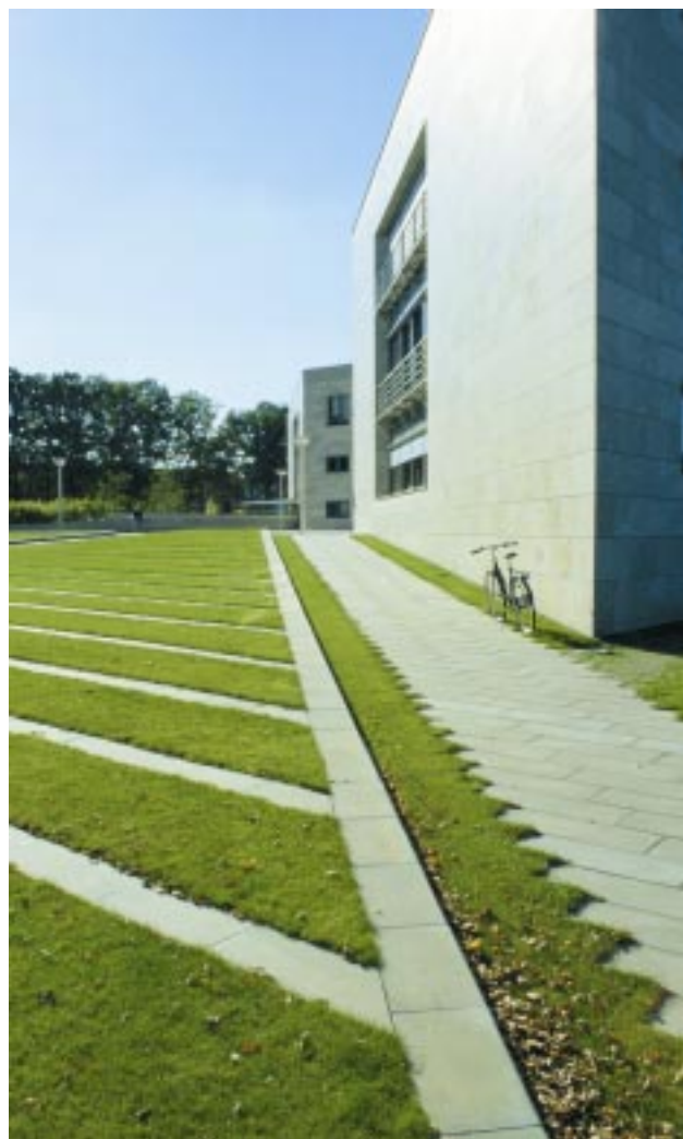
6. Sti til forplads

Landskabsarkitekterne er meget tilfredse med resultatet af belægningsarbejdet. Belægningssten og fliser har fuldt ud levet op til forventningerne. Der blev blandt andet stillet skrappe krav til målene på fliserne til forpladsen, specielt omkring afvandskanalen.