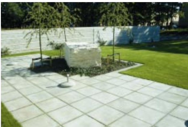
9. Kantinehave med travertinblok

Vedligeholdelsen foretages på flerårig kontrakt af anlægsgartnerfirmaet, der har lagt belægningen.