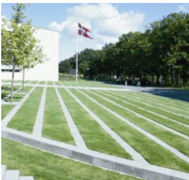
1. Græsplan med bånd af fliser

Der er lagt ialt ca. 1400 m 2 fliser, 3000 m 2 belægningssten og 1200 m 2 græsarmeringssten. Entreprissummen er på kr. 4,5 millioner for selve belægnings- og beplantningsdelen. Hele byggeriet står til en sum af kr. 89 millioner.