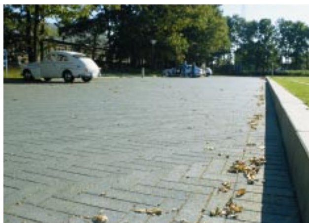
7. Parkeringsplads med 10 x 30 cm sten