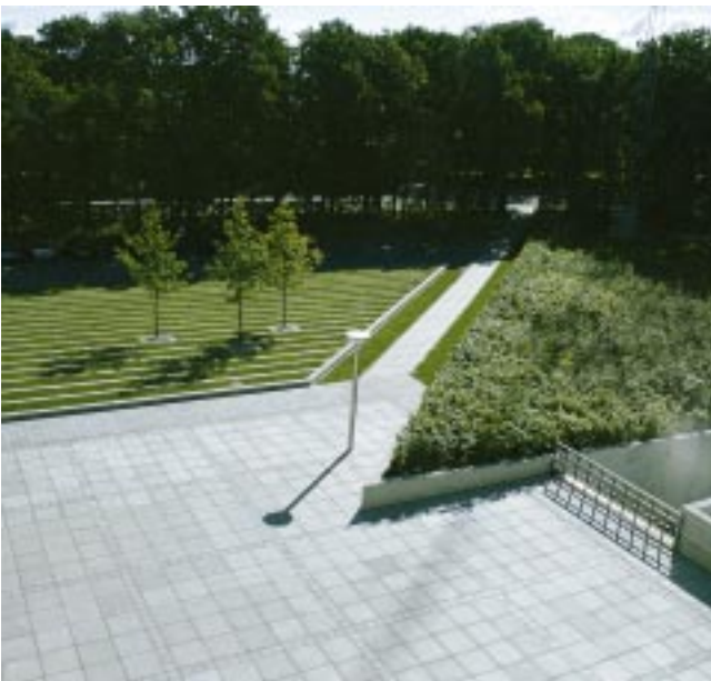
4. Forplads set fra oven