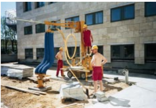
10. Lægning af fliser med sugekop