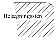
Afrunding set fra siden.