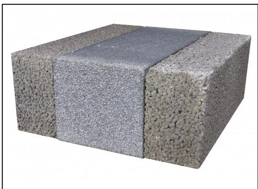
Letklinkerblok, grå kerne (med grafit)