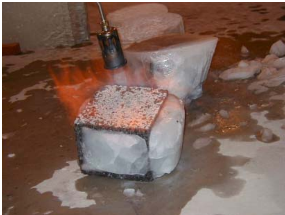
Billede 3. Tørring af overflade (Gas tor )