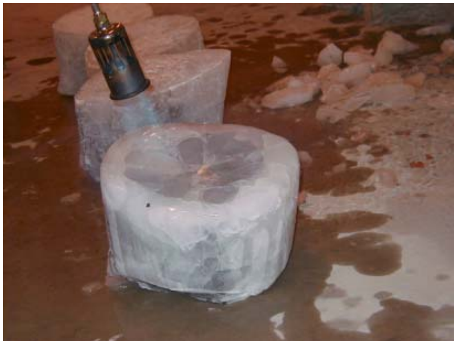
Billede 2. Afbrænding af is ( \text{Gas}_{\text{is}} )