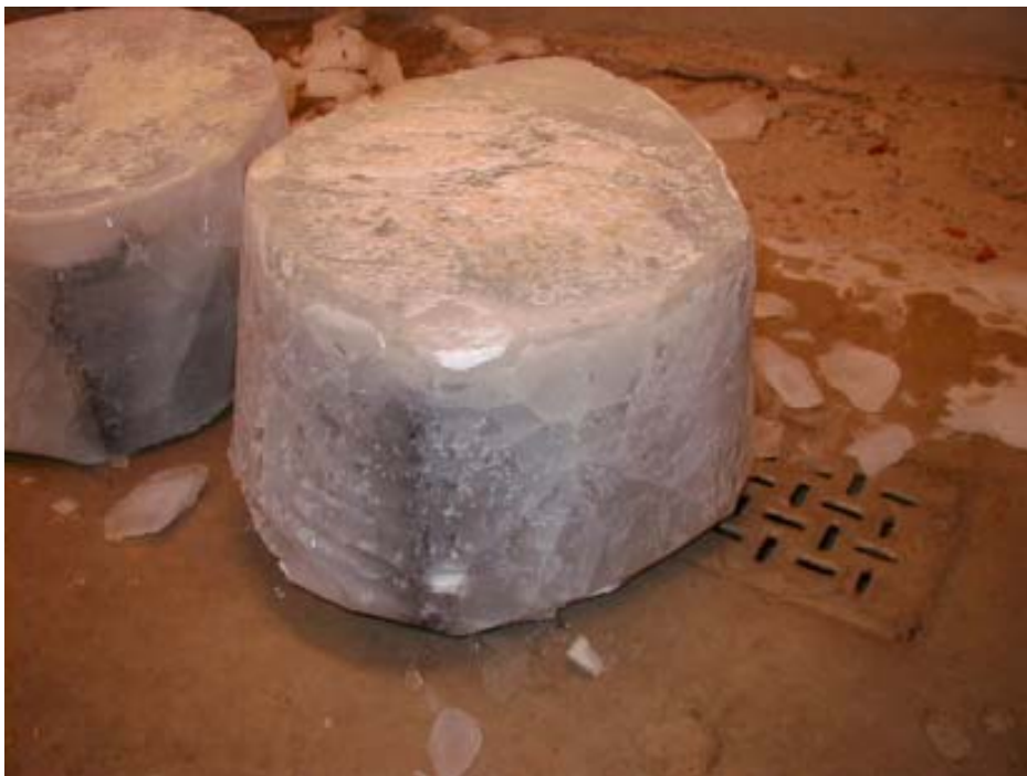
Billede 1. Blok efter frysning